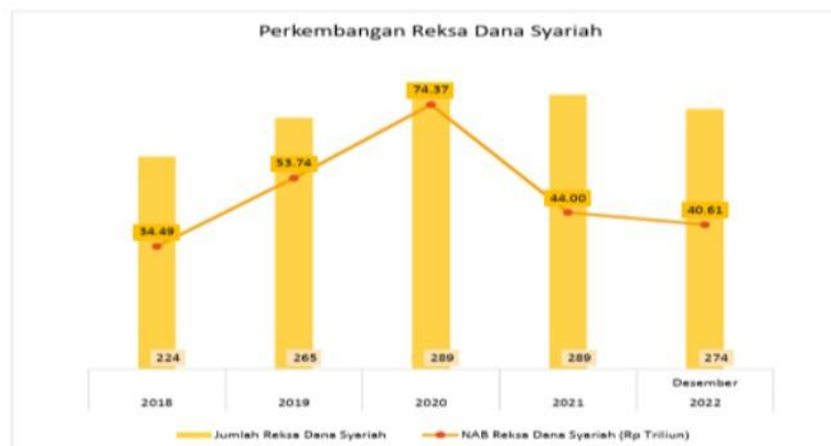
Gambar 1 : Perkembangan Reksa Dana Syariah

Reksa dana syariah adalah sekumpulan dana yang ada pada portofolio sekuritas yang berasal dari prorangan atau perusahaan. Portofolio aset yang mendasari reksa dana pada dasarnya sama dengan reksa dana konvensional (SYAIWA, 2023). Namun aset tersebut bersifat syariah seperti saham syariah, sukuk, deposito syariah, dan reksa dana syariah. Reksa dana syariah memiliki penempatan aset dasar minimal 80% pada saham syariah (Adenan et al., 2021). Secara umum, reksa dana selalu mempertimbangkan kinerjanya dalam pasaran untuk meningkatkan minat masyarakat dalam melakukan investasi syariah. Setiap reksa dana syariah memiliki tolak ukur tersendiri yang dapat dilihat oleh seluruh investor pada portofolio yang ada. PT Danareksa menginisiasi munculnya reksa dana syariah di Indonesia pada tahun 1997. Setelah inisiatif tersebut, reksa dana syariah berkembang cukup pesat dari tahun- ketahunnya di Indonesia walaupun ada beberapa tahun yg mengalami penurunan kecil.