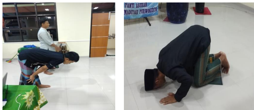
Gambar 3 :Contoh Peserta Mempraktekkan Shalat