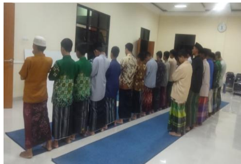
Gambar 4 : Siswa mempraktekkan shalat berjama'ah