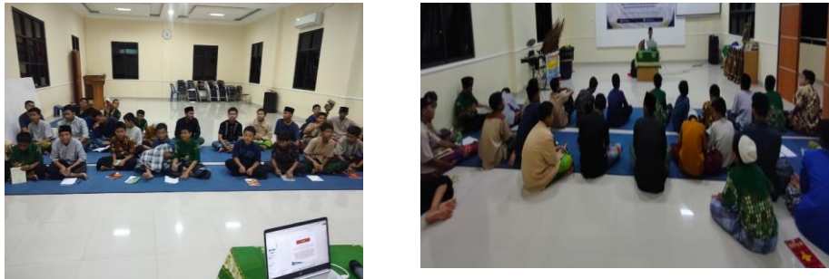
Gambar 2 : Narasumber sedang menyampaikan Materi

Pada pemaparan materi dilakukan secara runtut, yaitu :